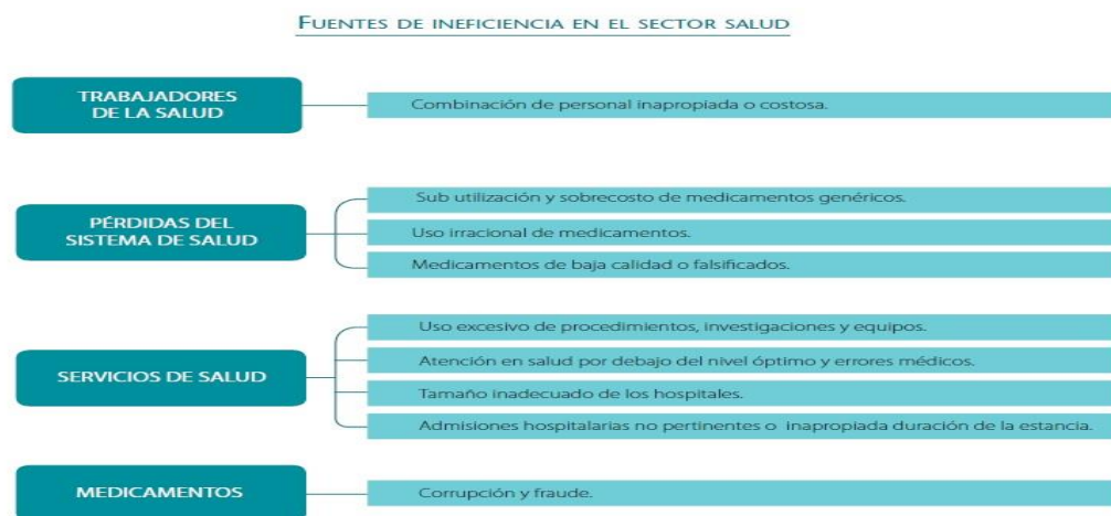
Figura 3. Fuentes de ineficiencia en el sector salud 1 .

La importancia de hablar de estos modelos de medición en los modelos de sistemas de salud implica hablar de nuestro contexto. Al