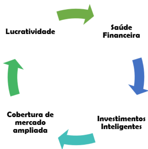
Figura 2. Fluxo Estratégico

A conveniência quanto a definição de prazos, por exemplo, se as estratégias devem ser adotadas a curto ou longo prazo, ficam a cargo da organização conforme o conhecimento que ela mesma possui do desempenho rotineiro de suas atividades. Adianta-se que o fluxo das estratégias sugeridas fica ilustrado da seguinte forma: